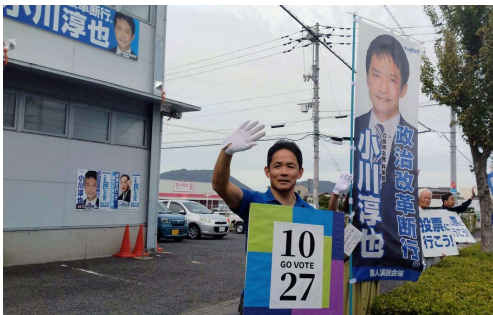
(選挙事務所で「投票に行こう!」と呼びかけ)

地域の皆様からご意見やご要望をお聴きする場として、後援会事務所(中間町・自宅)とは別に、香東校区・円座町に「政務活動事務所」を開設しています。